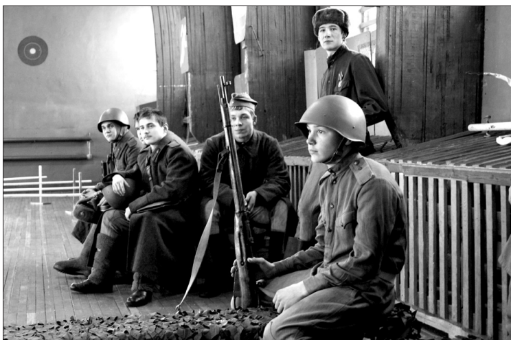
Участники фестиваля выступали в военной форме разных родов войск.