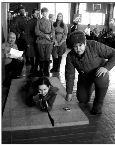
В состязании снайперов могли принять участие все желающие.