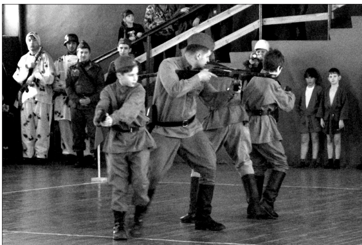
Реконструкция действий разведчиков в период Великой Отечественной войны.

С приветственным словом к участникам фестиваля обратился его организатор - настоятель Никольского храма протоиерей о. Владимир. Затем участники фестиваля посмотрели показательные выступления ребят из объединения «Самбо» Дома детского творчества, воспитанников военно-патриотического клуба «Ратники Руси» из Шарьи. На этот раз они реконструировали действия группы разведчиков в тылу врага в период Великой Отечественной войны и показали элементы рукопашного боя с вооруженным противником.