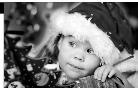
Страничку подготовила Ирина Константинова.

Враг № 4: ОТСУЖДЕНИЕ. Высказывайте свои идеи и недовольство, обсуждайте планы. Чем больше дел вы обговорите, тем равномернее распределится ответственность за их реализацию.