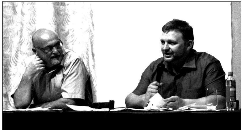
Н.Ю. Белых: «У власти и общества должно быть общее понимание перспективных задач».

Губернатор предложил Н.Д. Бусыгину не только обозначить главные для района проблемы, но и продумать пути их решения. Он отметил, что проблема демографии, на его взгляд, - одна из основных: с ней тесно связаны образование, медицина, спорт и некоторые другие отрасли. Никита Юрьевич отметил, что перед регионом стоит достаточно амбициозная задача: к 2015 году область должна выйти на естественный прирост населения. В свя-