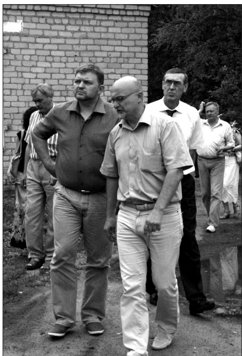
Губернатор Н.Ю. Белых побывал в детском саду «Теремок»; посетил детский дом и Дом детского творчества.