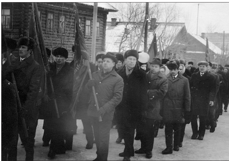
Улица Свободы. Проходит демонстрация к 7 ноября.