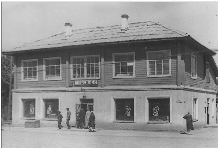
Магазин «Василёк». Фото 70-х годов из архива краеведческого отдела ЦКиД.

Ещё помню высокий бревенчатый дом, каждую весну он утопал в черемуховом цвету, аромат стоял густой, пьянящий. А в один год он по-