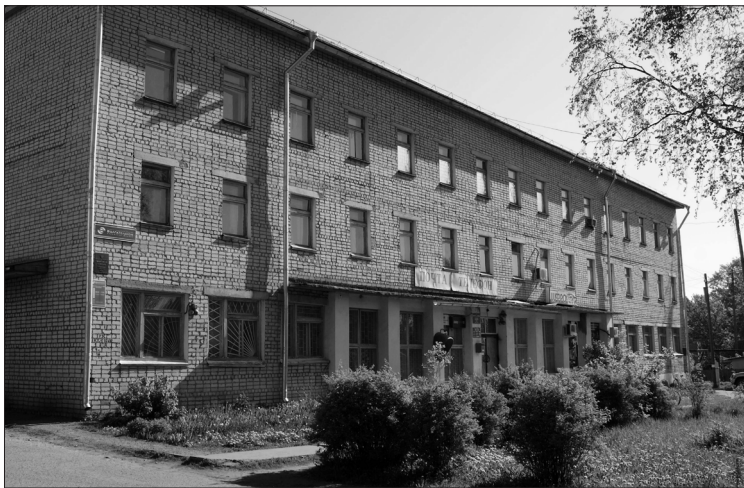
Современное здание почтамта.

разил меня своим видом: тля, словно белым саваном, закрывала и деревья, и уже пустующий дом. И только чёрные глазницы окон глядели уныло и обреченно. Вскоре срубили деревья, разобрали дом. Позднее на этом месте вырос ЦКиД.