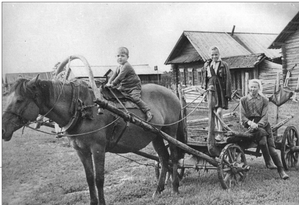
Мама со своими юными помощниками собралась в поле (деревня Бурковы, 1956-1970 гг.).

«Весной мы, дети, работали на вывозке навоза, лошадей было мало, поэтому запряга-