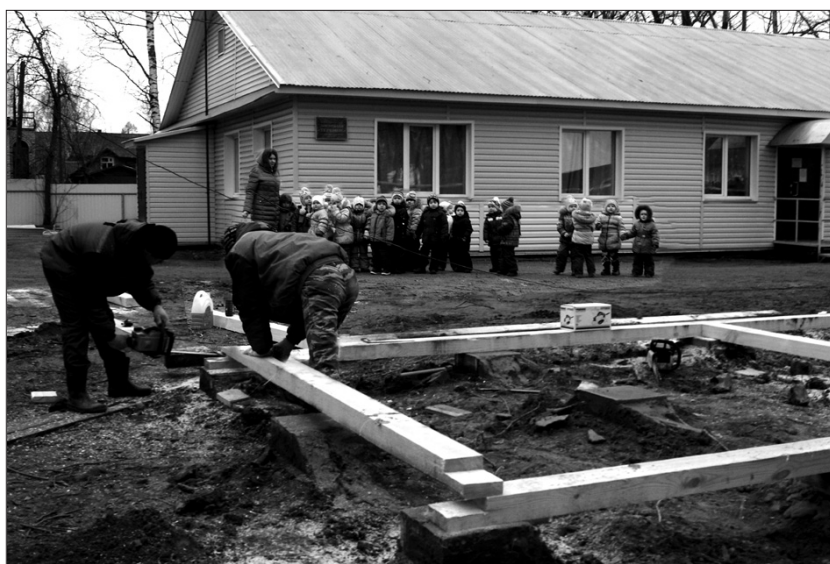
На этой неделе строители завершат монтаж второй закрытой веранды.

Напомним, что в 2011 году было подписано тройное согла-