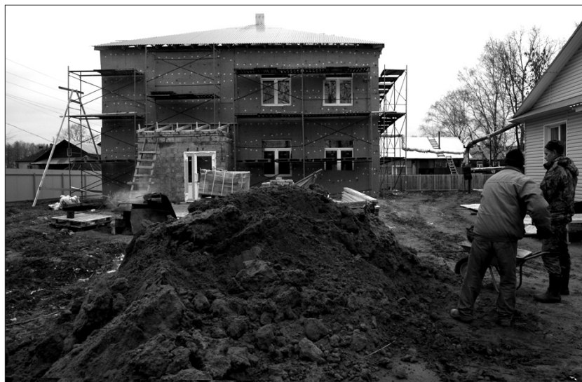
На четвертом здании «Теремка» ведутся фасадные работы.

шение «О взаимном сотрудничестве между правительством Кировской области, департаментом образования и Свечинским районом». Району выделялись средства на введение 88,5 дополнительных мест в дошкольных учреждениях, в том числе на строительство четвертого здания детского сада «Теремок». Здесь планируется открыть группу на 25 мест (1 этаж) и физкультурно-музыкальный зал (2 этаж).