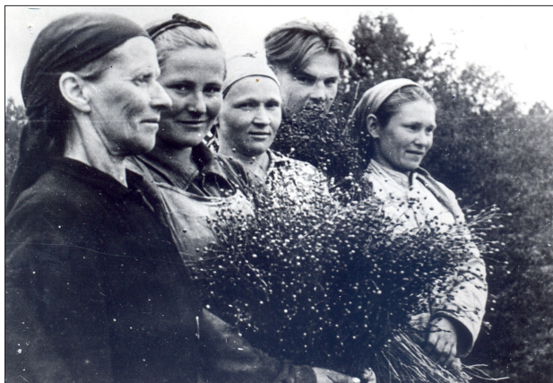
Хороший лен вырастили льноводы Ашлановской бригады (1950-1955 гг.).