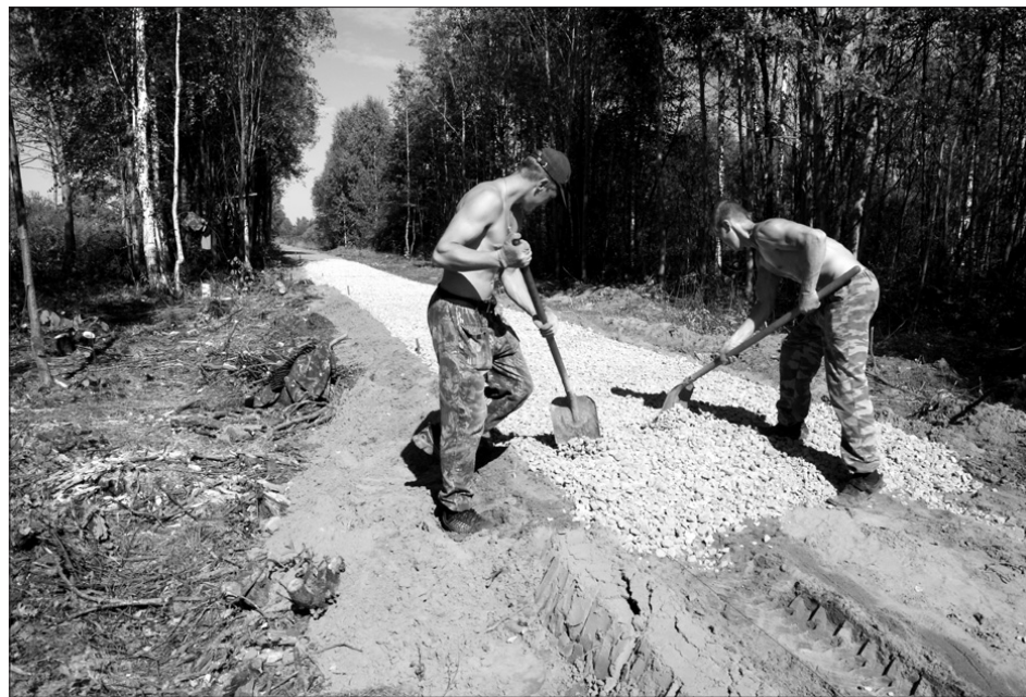
Строительство тротуара от микрорайона маслозавода до центральной части поселка.

Следует отметить, что, имея опыт участия в данном проекте, в этом году по всем объектам была своевременно и качественно подготовлена вся необходимая документация, в требуемые сроки проведены аукционы по выбору подрядчиков и с фирмами, вы-