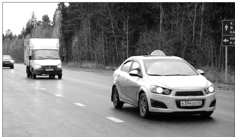
Отремонтированный участок дороги (обход поселка Радужный под Кировом).